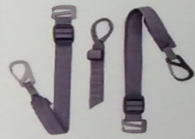
腳架支撐吊繩 (另售) -MS300