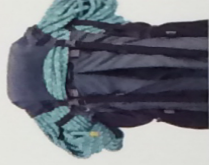
頂部置物袋 (另售) -MS806