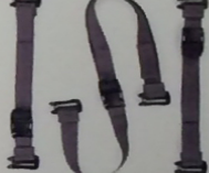
腳架束帶 (另售) -MS800