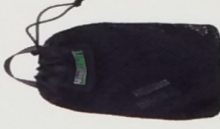
防水地墊 (另售) -MS904